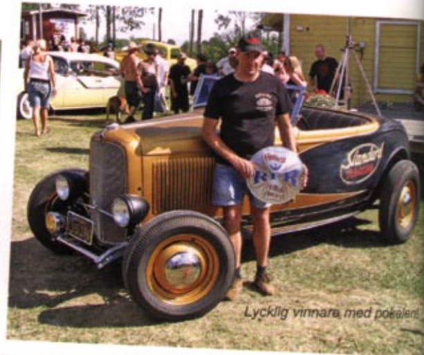
Lycklig vinnare med pokalen!

kan poleras igenom med rubbing. Det ger en väldigt fin nötnings-effekt som ser ut som fyrtio år av varsam gubbvaxning. Patinering är skitkul!