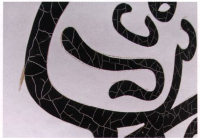
Honest Charley-loggan efter krackeleringprocess.

- Det sägs att konstformen uppstod för att täcka över mindre repor! "Gör något snyggt här. Tidningsbudet cyklade in i huven! ■