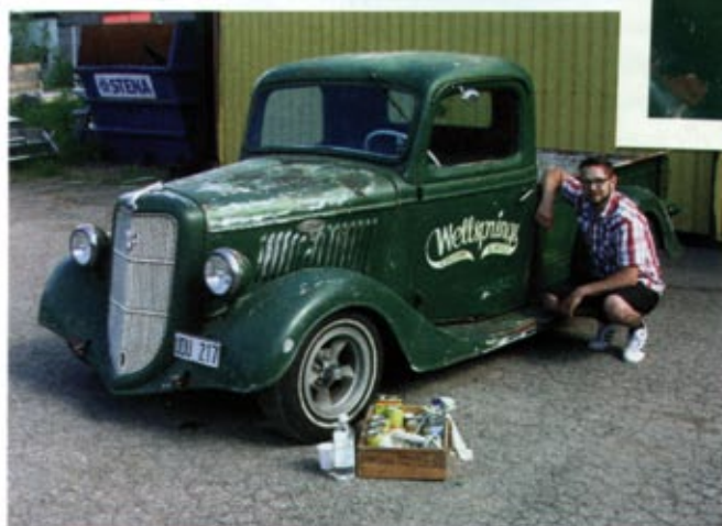
En nöjd ägare poserar vid sin nytextade och väderbitna Ford Pickis från 1935.