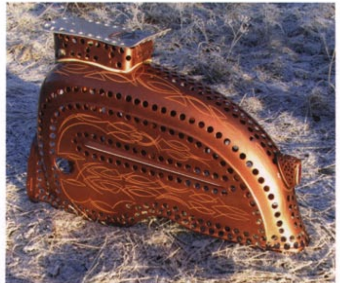
Hålborrat och pinstripes i helig allians på denna bakdel till en Monarped.

Senare blir man snabbare, mera effektiv. Man kan även lämna de enklare formerna och ta ut svängarna mera. Fullärd blir man aldrig och det är en del av tjusningen med konstformen.