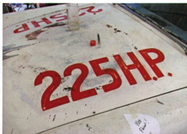
Textning med patina, denna gång på en Ford Customline från 1956.

- Det finns många trick när det gäller patina, eller antikbehandling som det också kallas. Enklast är att gå på det målade området med stålull dagen efter. Man måste ha lite koll på hur långt färgen härdat, men det känner man ju när man går igång. Härdad färg